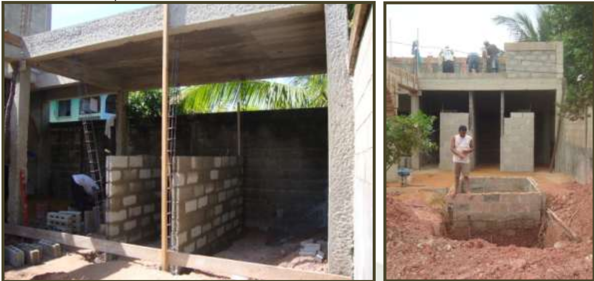
Foto's boven: Links, het begin van de wc ruimte. Op de rechterfoto het vooraanzicht van het wc-blok in wording, in het midden de deur naar de douche, links de meisjes, rechts de jongens. Bovenop de ruimte voor de medewerkers. Op de voorgrond, de uitbreiding van de put.

De eerste fase van de bouw van het multifunctionele centrum is voortvarend van start gegaan zodra de financiën rond waren (toezegging LBSNN en eigen fondsenwerving, najaar 2009). In deze eerste fase heeft Fundación Marijn in ruim een half jaar tijd de bouw gerealiseerd van ruimtes voor huiswerkles, voorlichtingsactiviteiten en de sanitaire voorzieningen, plus de inrichting van deze ruimtes en de buitenspeelruimte. Oorspronkelijk was het de bedoeling om twee grote kiosken te bouwen. Uiteindelijk is het ontwerp echter veranderd (na overleg met het LBSNN) en is een ruimte gebouwd van twee verdiepingen hoog. De benedenverdieping bestaat uit een grote halfopen ruimte van ongeveer 120 m 2 met capaciteit voor 45 personen, met aansluitend een afsluitbare ruime die dienst doet als opslag. Deze verdieping wordt twee dagen in de week gebruikt worden om 80 kinderen (in twee shifts) structurele ondersteuning bij hun huiswerk aan